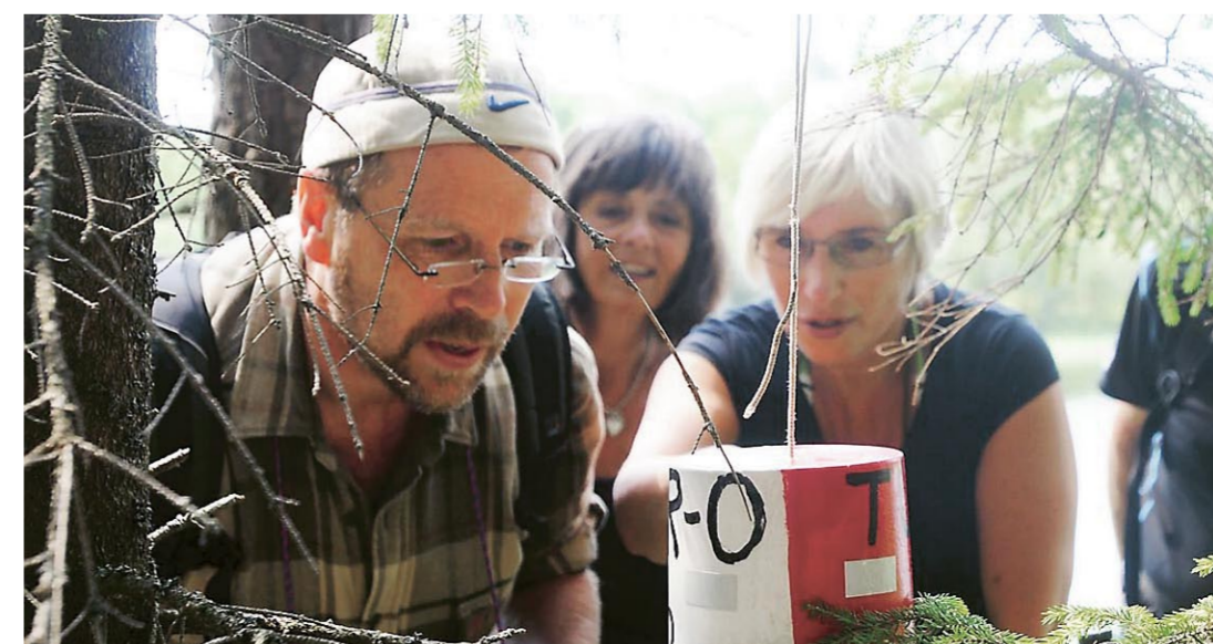
En gjeng med ivrige turorientere sjekker koden.